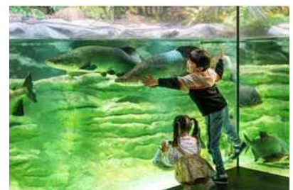
ミッション達成でプレゼントに応募しよう!

(※2) 夏の生き物：かわさき生き物マップで夏に投稿を募集している生き物。 タヌキ、アブラコウモリ、タンポポ、チョウ類、セミ類、トンボ類、カマキリ類、カエル類、トカゲ類、ツバメ、その他の野鳥、カニ類、エビ類、魚類の14種類が対象