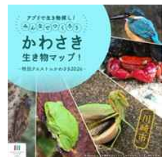
アプリ内に特別クエストが登場!

何気なく見過ごしてきた身近な生き物たちに目を向けることで、現実世界がゲームのように面白くなる体験を提供します。