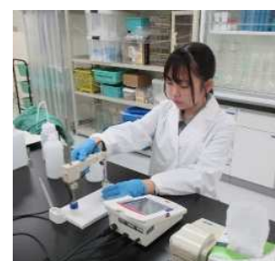
水の測定実験の様子