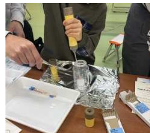
空気の測定実験の様子