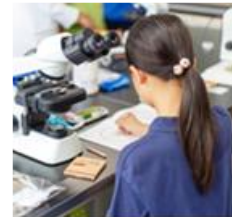
顕微鏡を使って ミクロの世界を観察