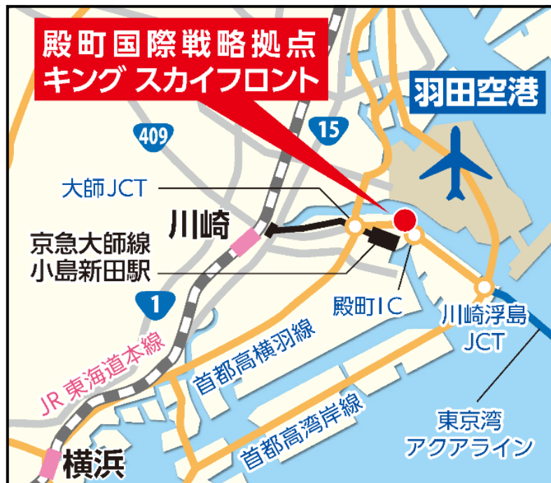
キングスカイフロント位置図

名称の「キング(KING)」は、「Kawasaki INnovation Gateway」の頭文字と「殿町」の地名に由来しています。「スカイフロント(SKYFRONT)」は、羽田空港の目の前という立地や、このエリアが世界につながっていることを表しています。