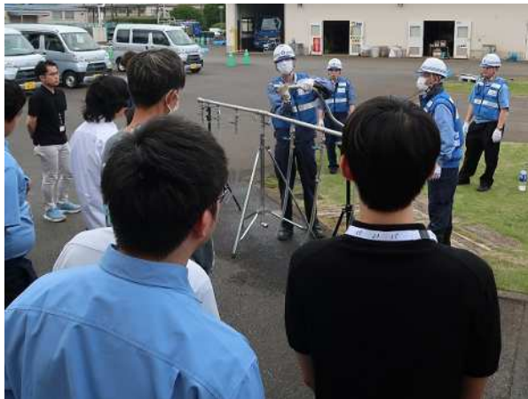
応急給水拠点の開設訓練