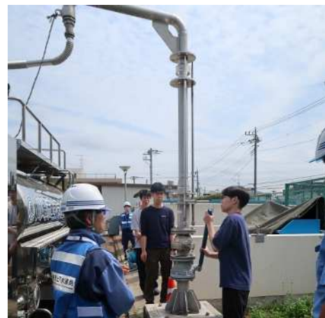
給水タンク車による給水訓練