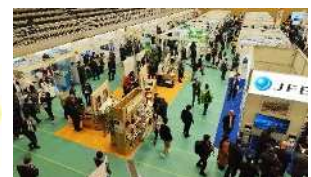
川崎国際環境技術展会場風景

「Kawasaki Eco-Tech Champ Project」の略称。 川崎国際環境技術展(Kawasaki Eco-Tech Fair)を 起点として、市場のチャンプ(Champ)となる製品・ サービスを生み出していくことをモチーフとしています。