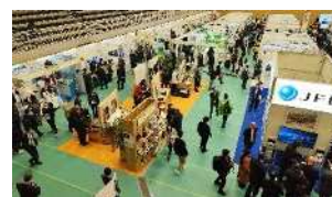
川崎国際環境技術展会場風景

「Kawasaki Eco-Tech Champ Project」の略称。 川崎国際環境技術展(Kawasaki Eco-Tech Fair)を 起点として、市場のチャンプ(Champ)となる製品・ サービスを生み出していくことをモチーフとしています。