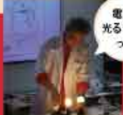
東芝 HERITAGE SQUARE