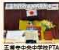
王禅寺中央中学校PTA

川崎市立下作延小学校PTA 川崎市立橋小学校PTA 川崎市立中野島小学校PTA 川崎市立祐生小学校PTA 川崎市立真福寺小学校PTA