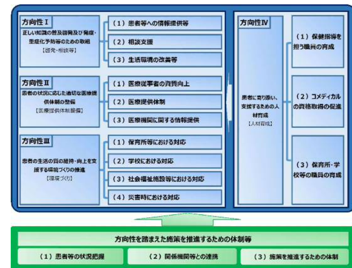
【本市施策の方向性 体系図】

「本市のアレルギー疾患対策の現状」「総合的なアレルギー疾患対策を進める上での視点」、「今後の本市施策の方向性」を整理すると次頁「本市のアレルギー疾患対策の現状と今後の方向性」のとおりのようになります。