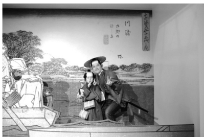
江戸風衣装での写真撮影もできる 東海道かわさき宿交流館

東海道沿道にある「東海道かわさき宿交流館」では、川崎宿や川崎の歴史展示や解説員がおり、川崎の歴史を深く知ることができます。学んだ後に街歩きをすると、様々な発見があり楽しくなりますよ。また夜には、浮世絵等がイラストされた行灯が東海道沿道に彩りを加えており、風情を楽しみながらゆっくりと歩いてみるのもお勧めです。