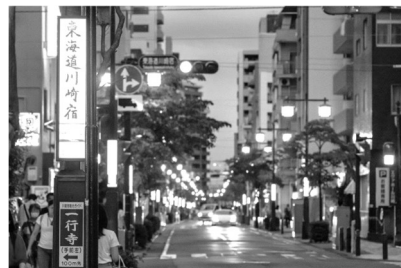
東海道沿道に設置された100を超える中間灯 には10種類の浮世絵が描かれています