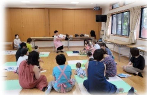
「子育てサロン」スタッフによる読み聞かせ

この20年間で延べ18万人以上の方にご参加いただき、親御さん同士が会える場であることはもちろん、地域の人や地域のことを知るきっかけの場にもなっています。これからも子育てサロンで生まれたつながりを支え、中原区での子育てを応援していきます。