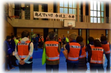
今井中学校における総合防災訓練の様子

また、区民一人ひとりの防災意識向上と備えの普及のため、自主防災組織や学校など区内のさまざまな団体に対する、ぼうさい出前講座や地域・行政・関係機関が連携し、避難所となる区内の市立学校を会場にした中原区総合防災訓練を実施するなど、災害時の助け合いを促進する取組を進めています。