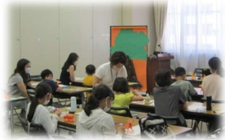
親子向け認知症サポーター養成講座の様子

（お問い合わせ）中原区役所 地域支援課 電 話：044-744-3380 F A X：044-744-3196