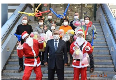
クリスマスケーキ配布事業