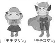
生田緑地キャラクター

生田緑地に近い登戸・向ヶ丘遊園駅周辺の区画整理事業により、古くからの街並みや景色が大きく変化を続ける中、新たに多摩区へ転入されて来た方も多くいらっしゃるかと思います。また、2024年には「全国都市緑化かわさきフェア」のメイン会場の一つとして、市内外から多くの来場者が見込まれます。周辺の環境が変わっても、生田緑地ではおもてなしの心を持って花と緑に親んでもらえるよう、さまざまな分野のボランティア募集を行っています。花壇の整備など1回から参加できるボランティアもありますので、地域のみなさんとのつながりを広げながら、生田緑地を大きな庭だと思って気軽に遊びに来てもらえたらと思います。