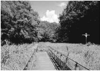
戸隠不動口近くのホタルの里