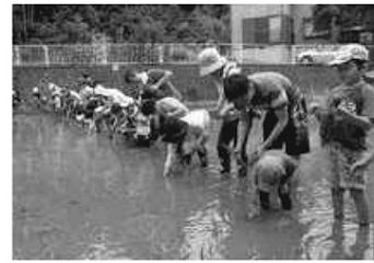
農業体験（どろんこ教室）