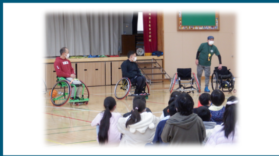
稲田小学校での車いすバスケット体験