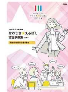
(かわさき☆えるぼし事例集)