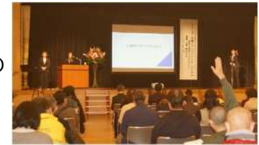
(男女共同参画かわさきフォーラム)