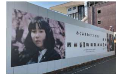
(大型ポスターの掲出)