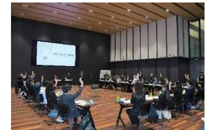
(外国人市民代表者会議)