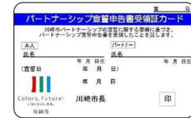
(パートナーシップ宣誓申告受領証カード)