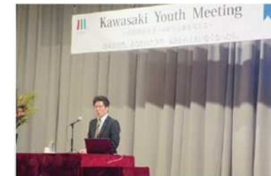
(「Kawasaki Youth Meeting」 カワサキ・ユース・ミーティング)