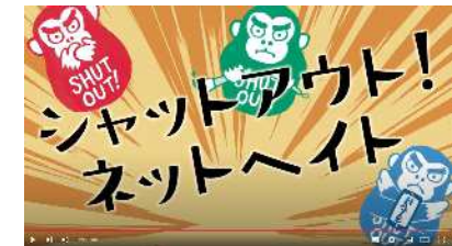
(本邦外出身者に対する不当な差別的言動の解消に向けた啓発動画)