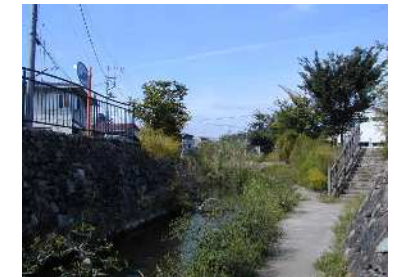
川崎堀（平間、昭和初期） 久地円筒分水完成時（昭和16年） 多摩区中野島周辺環境整備（平成初期）