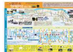
二ヶ領用水知絵図