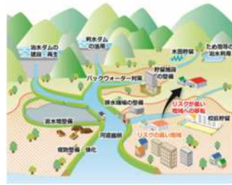
流域治水イメージ図