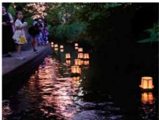
灯籠流し & 清掃活動

・令和6年度、川崎市は市制100周年を迎え、その象徴的事業である「全国都市緑化かわさきフェア」などの取組をすすめました。二ヶ領用水における市民協働の取組として、河川愛護ボランティア活動への理解や参加に繋げる清掃活動や、楽しい体験を通じて愛着の醸成を図る地域密着型のイベント等を行い、二ヶ領用水に対する市民意識の向上、市民連携・交流の場としての活用を推進しました。また、いつでも誰でも気軽に二ヶ領用水に触れ合えるように二ヶ領用水散策マップを「かわさきTEKTEK」のウォーキングコースに掲載しました。