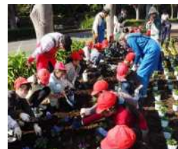
大師堀公共花壇花植え