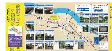
二ヶ領用水散策マップ