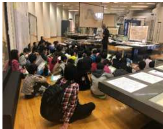
小学校社会科教育