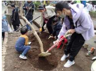
植樹・清掃活動 & 川下り