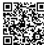
(川崎市病院局のホームページ)

川崎市病院局総務部庶務課 電話 044-200-3846(直通) FAX 044-200-3838 メールアドレス 83syomu@city.kawasaki.jp 川崎市病院局ホームページ「川崎市病院局」で検索